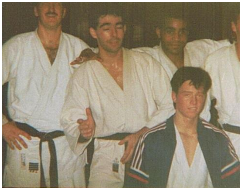
Kersttoernooi “Za-Zen” -71 en -78 kg december 1987